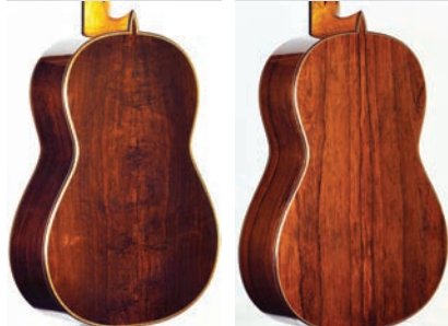
Modello Especial Modello Concierto