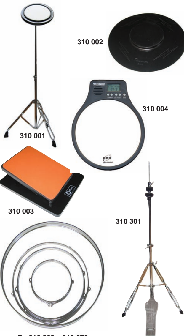
Da 310 262 a 310 278